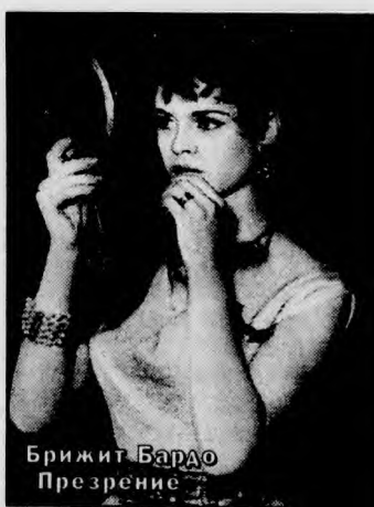
Брижит Бардо Презрение