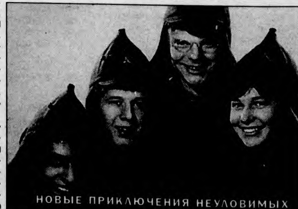
НОВЫЕ ПРИКЛЮЧЕНИЯ НЕУЛОВИМЫХ