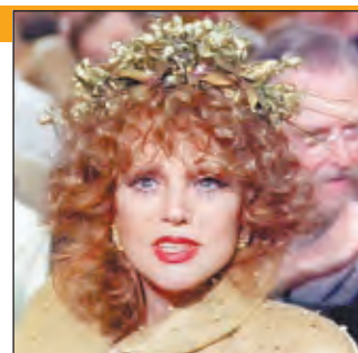
Х/ф "Старые клячи"

10.10 Мультфильм 11.15 "ИНКОГНИТО ИЗ ПЕТЕРБУРГА" 12.40 Легенды мирового кино 13.10 "МНИМЫЙ БОЛЬНОЙ" 15.10 Человек в шляпе. Анатолий Ромашин 15.50 "Экватор". Док. сериал 16.45 Концерт "Шлягеры уходящего века" 17.35 Евгения Ханаева. Под звуки нестаряющего вальса 18.20 Любимые романсы и песни 19.25 "МИСТЕР ИКС" 20.55 Божественная Гликерия 21.35 Герард Васильев и "ОпереттаLand – 2010". Гала-концерт