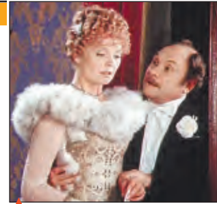
▲ Х/ф "Принцесса цирка"

10.25 "ПРИНЦЕССА ЦИРКА" 12.55 Линия жизни 13.55, 23.50 "АРТЕМИЗИЯ САНЧЕС" 15.30, 19.30, 23.30 Новости культуры 15.40 "Белая овца". Телеспектакль 17.35 Искусство быть смешным 18.30 Премия "Gramophone". "Лучшая инструментальная запись года". Аркадий Володось (фортепиано) 19.45 Главная роль 20.05 Юбилей Джеймса Фирсовой. Сны возвращаются 20.45 "Великая тайна воды". Док. сериал