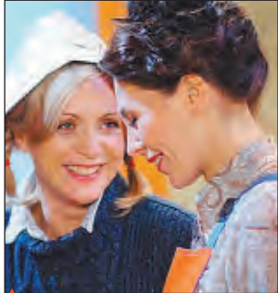
▲ Сериал "Слово женщине"

5.00, 9.00, 12.00, 15.00, 18.00, 23.30 Новости 5.05 Доброе утро 9.20 Контрольная закупка 9.50 Жить здорово! 11.00 ЖЖХ 12.20 Модный приговор 13.20 Детективы