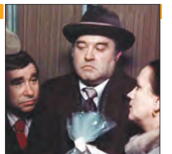
▲ Х/ф "Не было бы счастья..."

6.30 Доверие 7.30, 9.00, 13.00, 18.00, 22.00 Новости 7.40, 2.15, 3.05 "НЕ БЫЛО БЫ СЧАСТЬЯ..." 8.25 Замечательное рядом 8.50, 14.45 Как живете, москвичи? 8.55, 11.35 Обзор прессы 9.15, 18.15 Программы окружных студий 11.40 Обратная связь 12.10, 17.40 Мультфильм 12.25 Социальный вопрос 13.15, 16.40 Дела житейские 13.50, 4.15 "ЗИМНЯЯ ВИШНЯ" 15.00, 5.10 "На всех парах". Док. сериал 15.30 В движении 15.50 Юротдел 16.05, 3.50 "Телеэнциклопедия: воспитание домашних животных". Док. сериал 17.10 Школа материнства 20.30 Пять вопросов