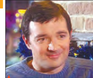
▲ Х/ф "История любви, или Новогодний розыгрыш"

10.40 "ПОД КРЫШАМИ МОНМАРТРА" 13.00, 20.45 "Великая тайна воды". Док. сериал 13.55, 23.50 "АРТЕМИЗИЯ САНЧЕС" 15.30, 19.30, 23.30 Новости культуры 15.40 "МОЛОДО-ЗЕЛЕНО" 17.10 Олег Табаков. Творческий вечер в Доме актера 18.25 Мировые сокровища культуры 18.40 I международный фестиваль "Неделя Ростроповича". Английский камерный оркестр 19.45 Главная роль 20.05 Больше, чем любовь