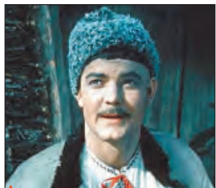
▲ Х/ф "Вечера на хуторе близ Диканьки"

11.00, 11.30, 13.45, 14.00, 14.30, 16.00, 16.30, 20.00, 20.30, 23.50 Вести 11.50 "МАРШРУТ МИЛОСЕРДИЯ" 12.50 "НАСТОЯЩАЯ ЖИЗНЬ" 14.50 "КУЛАГИН И ПАРТНЕРЫ" 16.50 "СЛОВО ЖЕНЩИНЕ" 17.55 "ЕФРОСИНЯ" 18.55 "ИНСТИТУТ БЛАГОРОДНЫХ ДЕВИЦ" 20.50 Спокойной ночи, малыши! 21.00 "КЛАССНЫЕ МУЖИКИ" 0.10 "ОПАСНЫЕ СВЯЗИ"