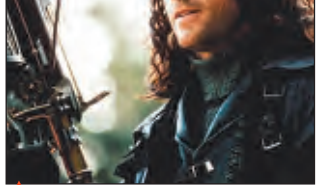
▲ Х/ф "Ван Хельсинг"

5.00 Утро России 9.05 Моя прекрасная леди. Татьяна Шмыга 10.00 О самом главном 11.00, 11.30, 13.45, 14.00, 14.30, 16.00, 16.30, 20.00, 20.30, 0.50 Вести 11.50 "МАРШРУТ МИЛОСЕРДИЯ" 12.50 "НАСТОЯЩАЯ ЖИЗНЬ" 14.50 "КУЛАГИН И ПАРТНЕРЫ" 16.50 "СЛОВО ЖЕНЩИНЕ" 17.55 "ЕФРОСИНЯ" 18.55 "ИНСТИТУТ БЛАГОРОДНЫХ ДЕВИЦ" 20.50 Спокойной ночи, малыши! 21.00 "КЛАССНЫЕ МУЖИКИ" 22.55 "ДЕВЯТЬ ПРИЗНАКОВ ИЗМЕНЫ" 1.10 "ВАН ХЕЛЬСИНГ"