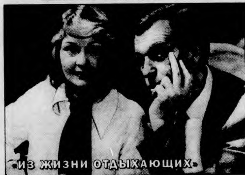
ИЗ ЖИЗНИ ОТДЫХАЮЩИХ