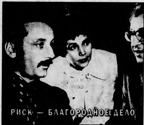
РИСК — БЛАГОРОДНОЕ ДЕЛО