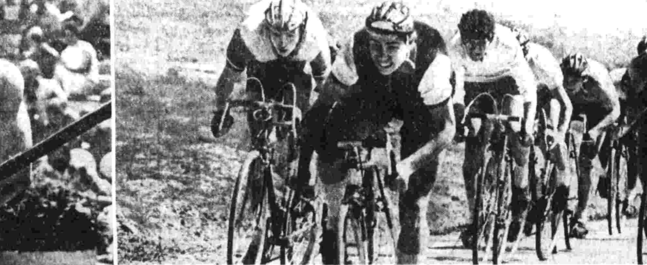
ФОТОКОНКУРС «ПРАВДЫ» А. СААНКОВ (Тбилиси). Последняя попытка. Е. ПЕТРОВ (Москва). Скоро финиш.

5 октября ПЕРВАЯ ПРОГРАММА. 21.00 - «Смешарики». 21.15 - «Детский мир».