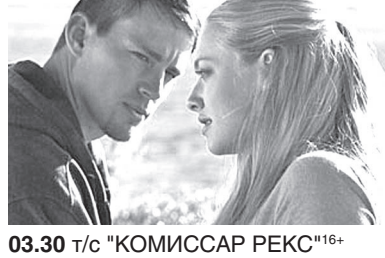
03.30 т/с "КОМИССАР РЕКС"