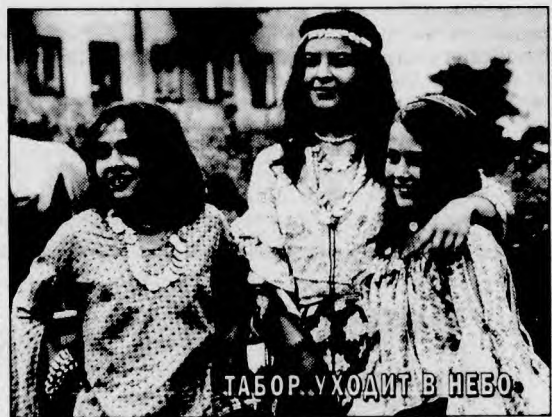
ТАБОР УХОДИТ В НЕБО

«ДОМ У ДОРОГИ». Патрик Суэйзи играет вышибалу Далтона, который работает в придорожной закусочной. У Далтона холодный рассудок, увесистые кулаки и... степень по философии. Его соперник — местная «шишка» Уэсли, который разбогател, вымогая деньги у бизнесменов. Режиссер — Р. Херрингтон. В других ролях: Бен Газзара, Келли Линч. США, 1987 г. (Воскресенье, 8 июня, 18.50).