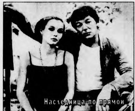
Наследница по прямой

Режиссер — С.Соловьев. В ролях: Т. Ковшова, Т. Друбич, И. Нефедов, А. Збруев, А. Сидоркина, А. Пороховиков, Г. Корольков, С. Плотников, С. Шакуров. "Мосфильм", 1982 г. (Воскресенье, 8 июня, 13.10).