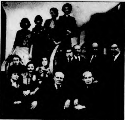
Семья П.Л. Капицы.