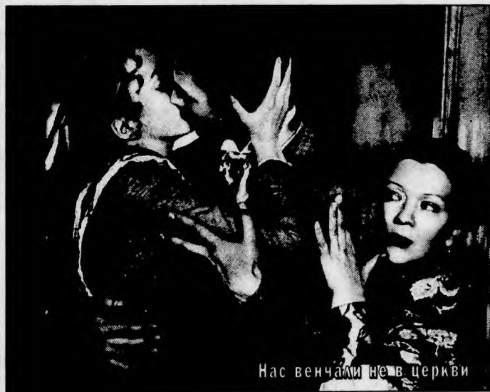
Нас венчали не в церкви

"НАС ВЕНЧАЛИ НЕ В ЦЕРКВИ" . Подлинная история из жизни революционера-