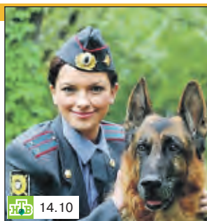
Сериал "Возвращение Мух- тара"

5.40 "МУР ЕСТЬ МУР" 7.25 Смотр 8.00, 10.00, 13.00, 16.00, 19.00 Се- годня 8.15 Золотой ключ 8.45 Академия красоты с Ляйсан Утяшевой 9.20 Готовим с Алексеем Зиминным 10.20 Главная дорога 10.55 Кулинарный поединок