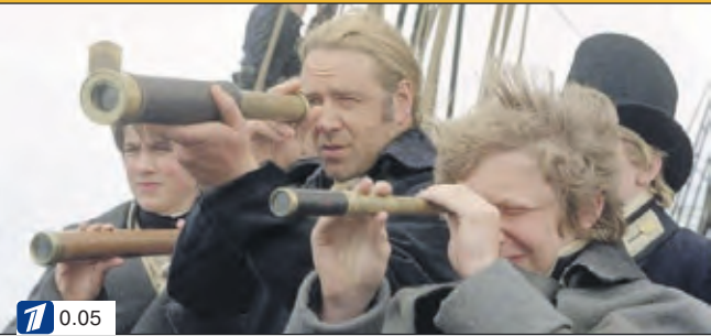
▲ Х/ф "Хозяин морей: на краю земли"

10.00 "ГОРЯЧИЕ ДЕНЕЧКИ" 11.30 Легенды мирового кино 12.05 "ДОБРО ПОЖАЛОВАТЬ, ИЛИ ПОСТОРОННИМ ВХОД ВОСПРЕЩЕН" 13.20 "Секреты пойменных лесов. Национальный парк на Дунае". Док. фильм 14.15 "Служить России". Концерт 15.15 "ДВА ФЕДОРА" 16.40 Больше, чем любовь