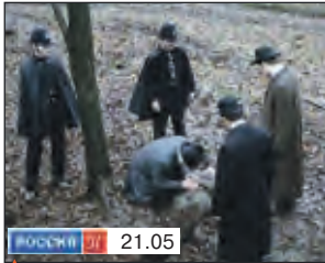
Х/ф "Шерлок Холмс. Комнаты смерти"

5.00, 9.00, 12.00, 15.00, 18.00, 0.35 Новости 5.05 Доброе утро 9.20 Контрольная закупка 9.50 Жить здорово! 10.50 Право на защиту 12.20 Модный приговор 13.20 Понять. Простить 14.00 Другие новости