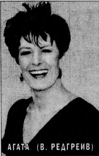
АГАТА (В. РЕДГРЕЙВ)

Шекспира — «Генрих V» завоевал два «Оскара». Комедию «Много шума из ничего» постановщик назвал самой блестящей и сексуальной в творчестве великого драматурга и счел своим долгом довести это до сведения зрителей. В ролях: Э. Томпсон, К. Брана, К. Ривз, Д. Вашингтон, М. Китон. Великобритания — США, 1993 г. (Среда, 4 марта, 21.50).