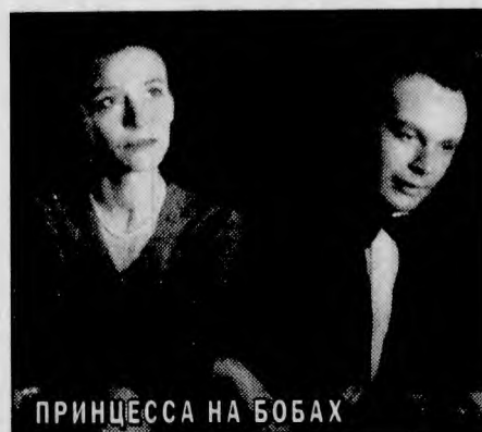
ПРИНЦЕССА НА БОБАХ

«ДЕЗИДЕРИЯ: ВНУТРЕННЯЯ ЖИЗНЬ». Никто, даже родная мать не понимает трагедии юной героини, страдающей чрезмерной полнотой. Девушка решает покончить с собой, но ее спасают, после чего она избавляется от полноты. Худоба полностью меняет ее жизненные планы. Мелодрама по роману А. Моравиа. Режиссер — Дж. Барчеллоне. В ролях: С. Сандрелли, К. Левиц, Л. Вендель. Италия, 1980 г. (Воскресенье, 8 марта, 0.35).