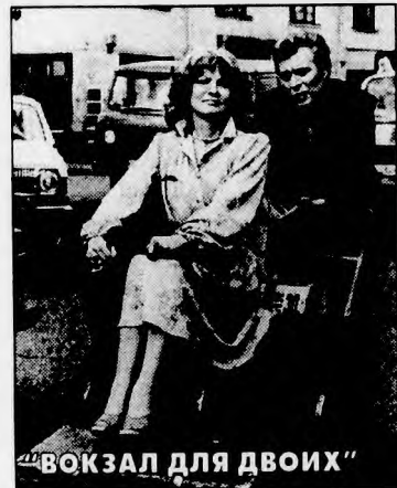
"ВОКЗАЛ ДЛЯ ДВОИХ"

"ВЗРОСЛЫЕ ДЕТИ" . Маленькие дети — маленькие заботы, большие дети — большие заботы. Именно так получилось у героев этой картины: их дочь неожиданно вышла замуж и в доме создалась