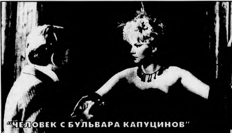
"ЧЕЛОВЕК С БУЛЬВАРА КАПУЦИНОВ"