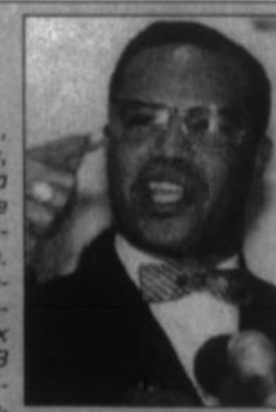
Луис Фаррахан поддерживает довольно тесные отношения с ливанским лидером Мусабом Каддафи и южноафриканским президентом Табо Мбеки...