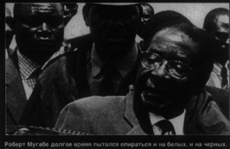
Роберт Мугабе долгое время пытался опираться и на белых, и на черных. Но желание усидеть в кресле президента оказалось сильнее