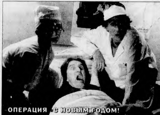
ОПЕРАЦИЯ “С НОВЫМ ГОДОМ!”