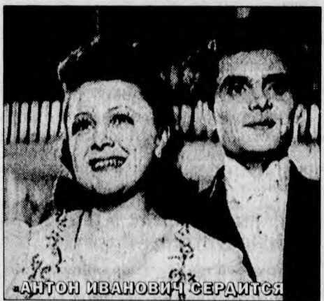
АНТОН ИВАНОВИЧ СЕРДИТСЯ

“АНТОН ИВАНОВИЧ СЕРДИТСЯ”. Дочь профессора консерватории увлеклась опереттой, а влюбленный в нее композитор Мухин пишет фокстроты. Все это возмущает Антона Ивановича до глубины души. В комедии А. Ивановского снимались: Н. Ковалов, Л. Целиковская (дебют), П. Кадочников, Т. Кондакова, С. Мартинсон. “Ленфильм”, 1941 г. (Воскресенье, 3 января, 12.10).