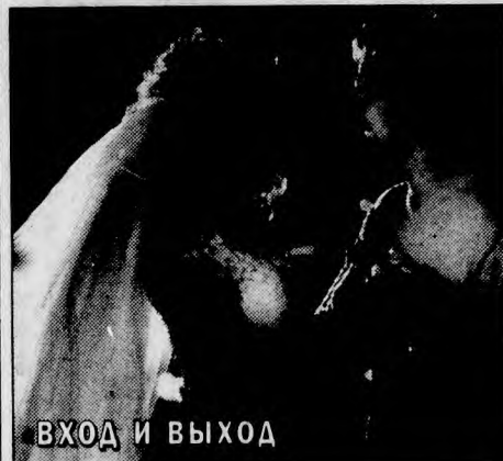
ВХОД И ВЫХОД