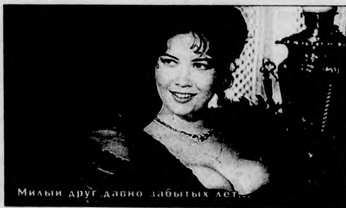
Милый друг давно забытых лет...

"МИЛЫЙ ДРУГ ДАВНО ЗАБЫТЫХ ЛЕТ..." Фильм по мотивам рассказа Алексея Толстого "Любовь". Режиссер — Самсон Самсонов. В ролях: