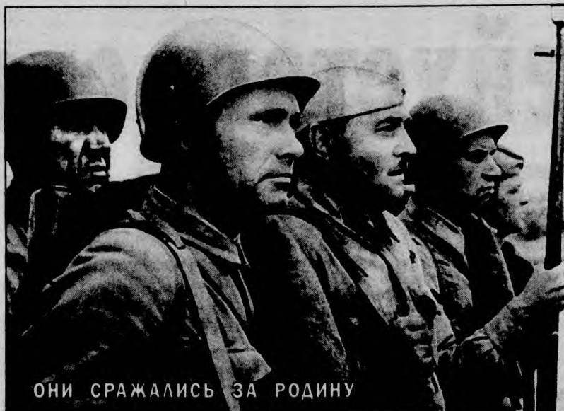
ОНИ СРАЖАЛИСЬ ЗА РОДИНУ

«ИЗМУРЯДНЫЙ СОЛДАТ». 1944 год. В плен к нацистам попадает американский офицер, обладающий полной информацией о стратегическом плане союзников. Чтобы найти пленного, пока он не заговорит, командование посылает разведчика, который проникает