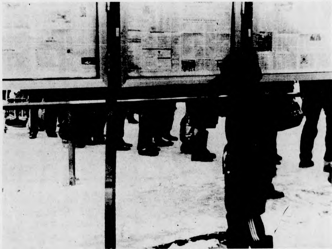
На политических перекрестках.

гражданской войны, неконтролируемого развала СССР. Стороны обменялись мнениями по самым разным вопросам. Без этой встречи, по мнению А. Козырева, информация британского министра о процессах, происходящих в стране и республике, была бы неполной и односторонней. (Соб. инф.).