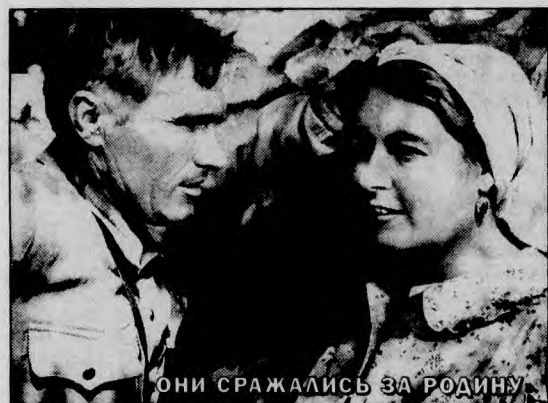
ОНИ СРАЖАЛИСЬ ЗА РОДИНУ