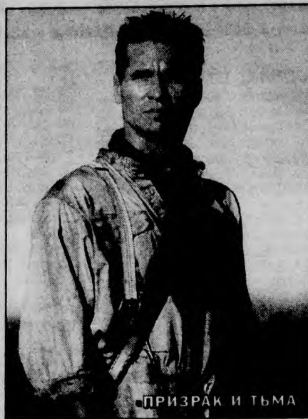
ПРИЗРАК И ТЬМА