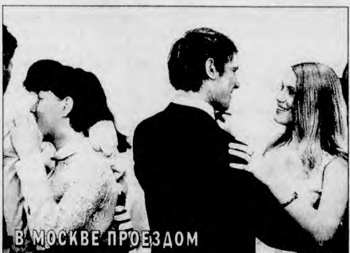
В МОСКВЕ ПРОЕЗДОМ