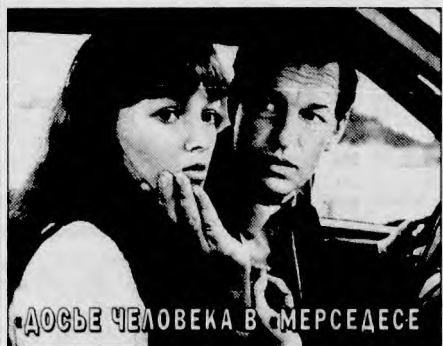
ДОСЬЕ ЧЕЛОВЕКА В МЕРСЕДЕСЕ