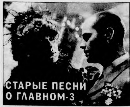
СТАРЫЕ ПЕСНИ О ГЛАВНОМ-3

Закончится новогодняя ночь на ТВ ЦЕНТРЕ праздничным ревью "БРАВО, МУЛЕН РУЖ!" Потрясающие аттракционы, гигантский аквариум с живыми крокодилами, знаменитые канканы обещает 100-летнее, но вечно молодое парижское варьете. (Среда, 31 декабря, 3.25.)