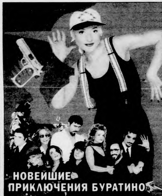
НОВЕЙШИЕ ПРИКЛЮЧЕНИЯ БУРАТИНО

даевской комедии "Иван Васильевич меняет профессию", которую закончим смотреть к полуночи. "Старые песни о главном-3" плавно перенесут нас к новым приключениям героев фильма. На "Мосфильме" отыскали старые декорации, и через 25 лет их оживили популярные певцы, не раз доказавшие, что могут и петь о главном, и перевоплощаться в известных героев, ничуть не испортив их таким "омоложением". Как родных встретят звезд друзья-артисты, игравшие героев "Белого солнца пустыни", "Семнадцать мгновений весны", "Иронии судьбы" и других фильмов 70-х. Пение возьмут на себя: Ф. Киркоров, К. Орбакайте, А. Буйнов, А. Алина, Н. Расторгуев, В. Пресняков, Т. Буланова, Г. Сукачев, В. Меладзе и другие. (Среда, 31 декабря, 0.02.)