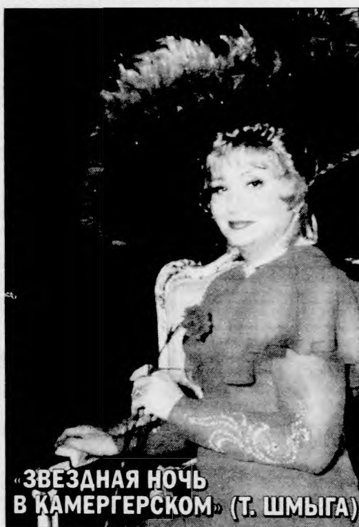
ЗВЕЗДНАЯ НОЧЬ В КАМЕРГЕРСКОМ (Т. ШМЫГА)

Сразу после "Старых песен о главном-3", которые станут последними в этом, вполне себя оправдавшем проекте ОРТ, кумиров дня сегодняшнего можно будет сравнить со многими из тех, кто создавал песенную моду два с лишним десятилетия назад. Программа "ЛУЧШИЕ ИЗ ЛУЧШИХ В НОВОГОДНЮЮ НОЧЬ" это: А. Челентано, А. Пугачева, Далида, М. Магомаев, А. Герман, Л. Лещенко, М. Родович, Альбано и