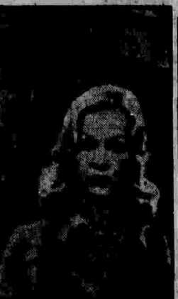
Письмо зрителя любимым героям телефильма двадцать лет спустя