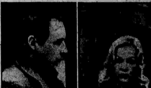
Письмо зрителя любимым героям телефильма двадцать лет спустя