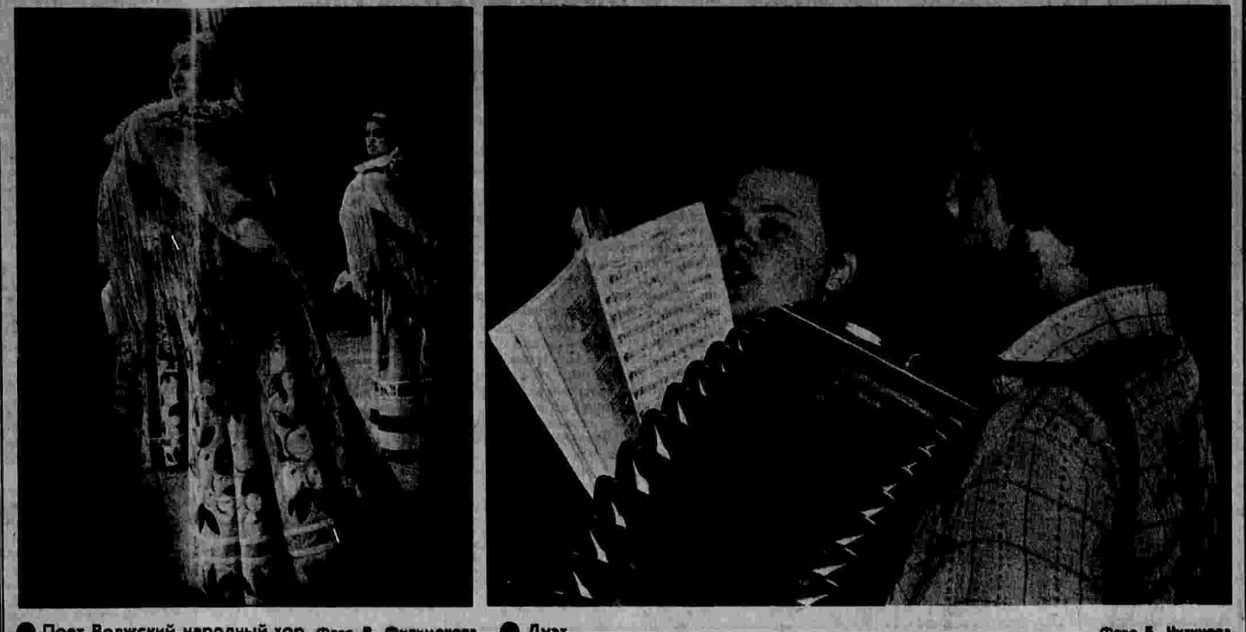
Поет Волжский народный хор. Дуэт.